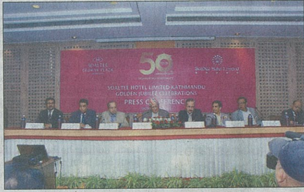
A handout photo shows a general view of an event organised by Soaltee Crowne Plaza in Kathmandu on Thursday.

"Nepal can benefit from the tourism business due to its