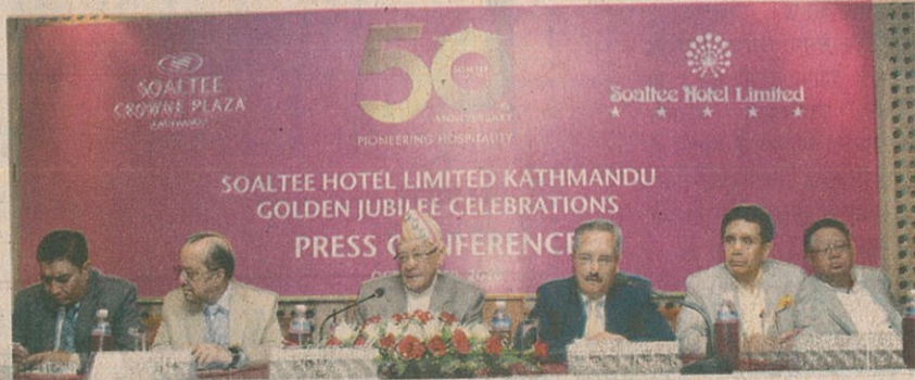
सोल्टी होटल लिमिटेडले ५० औं वर्ष पूरा गरेको छ।