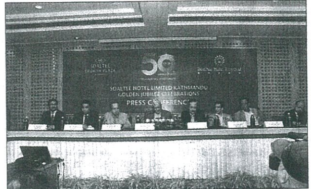
A handout photo shows a general view of an event organised by Soaltee Crowne Plaza in Kathmandu on Thursday.

"Nepal can benefit from the tourism business due to its